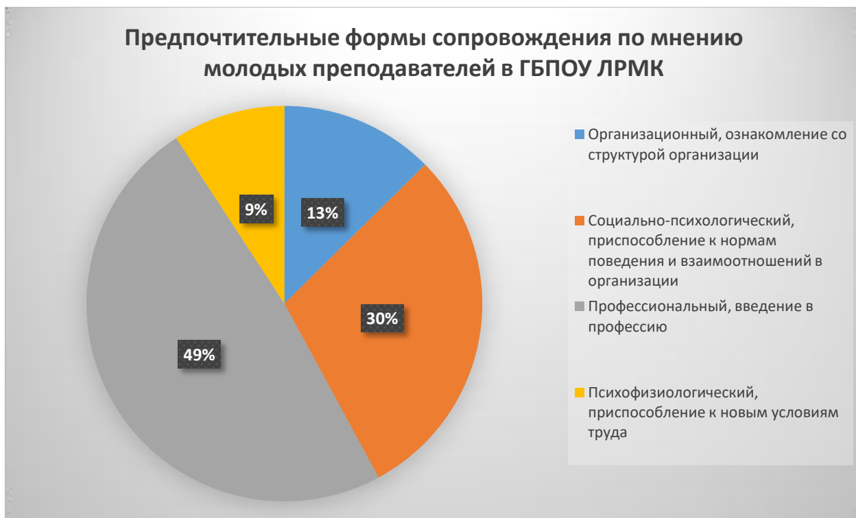
Рисунок 1 - Предпочтительные формы сопровождения по мнению молодых преподавателей в ГБПОУ ЛРМК

Оптимальным форматом помощи (сопровождения), по мнению респондентов, является связка помощи в рамках кафедры и консультаций толкового, неравнодушного завуча.